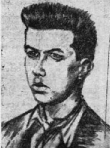
Un dessin remarquable d'un jeune membre du groupe.