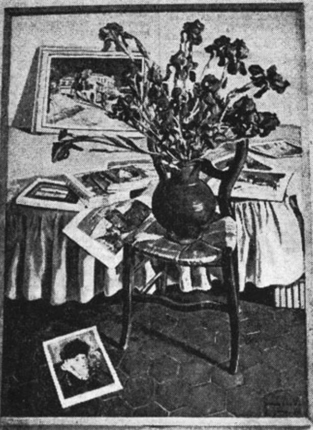
HOMMAGE A VAN GOGH. — Une toile particulièrement remarquable l'Exposition Guy Montis.